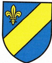
COMMUNE DE COEUVE